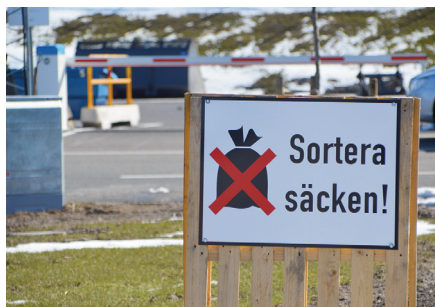
Sortera säcken har gällt på Heljeveds återvinningscentral sedan starten i början av året.